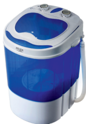
Mini washing machine with spinning function AD 8051