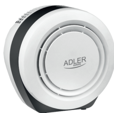
Air Purifier AD 7961