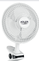
Desk fan 15 cm with clip AD 7317