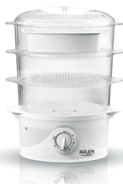
Steam cooker AD 633