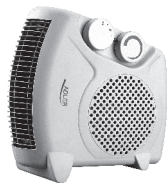
Fan heater AD 77