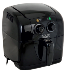
Air fryer AD 6307