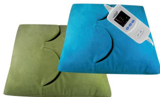
Electric heating pad AD 7403