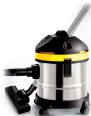
Canister vacuum cleaner AD 7022