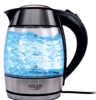
Electric kettle 1.8L AD 1246