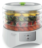
Food dryer AD 6654