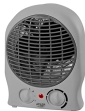
Fan Heater AD 7717