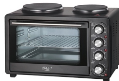
Electric Oven With HOB AD 6020