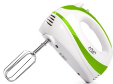
Mixer AD 4205