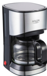
Dripp Coffee Maker AD 4407