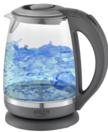
Kettle AD 1286