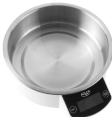
Kitchen Scale AD 8121