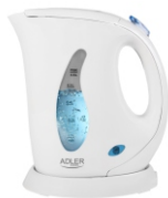
Electric Kettle AD 02