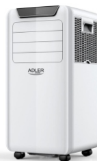
Air Conditioner AD 7916