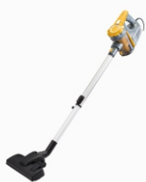
Bagless Vacuum AD 7036