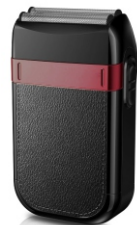
Hair Shaver AD 2932