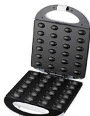
Nut Cookie Maker AD 3039