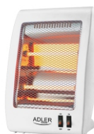
Quartz Heater AD 7709