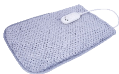
Electric heating pad AD 7415