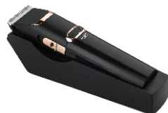
Hair Clipper AD 2832