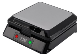
Waffle Maker AD 3036