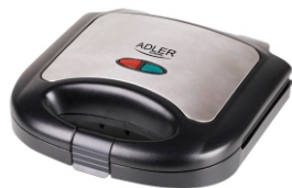
Sandwich maker AD 3015