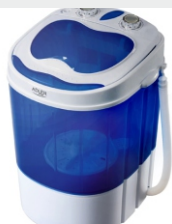
Mini washing machine with spinning function AD 8051