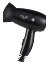
Hair Dryer AD 2251