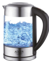
Water Kettle AD 1247 NEW