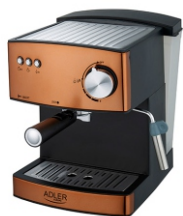
Espresso Machine AD 4404