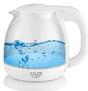
Water Kettle 1,0L AD 1283