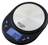
Precision scale AD 3162