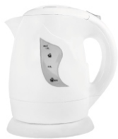
Electric Kettle AD 08