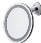
Led Bathroom Mirror AD 2168