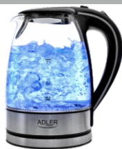
Electric Kettle AD 1225