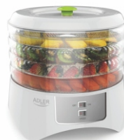
Food dryer AD 6654