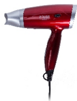
Hair Dryer AD 2220