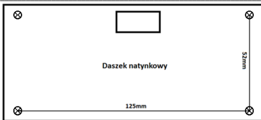
Rys. 1 Rozstaw otworów montażowych centrali wraz z daszkiem natynkowym. Średnica otworów: 5mm