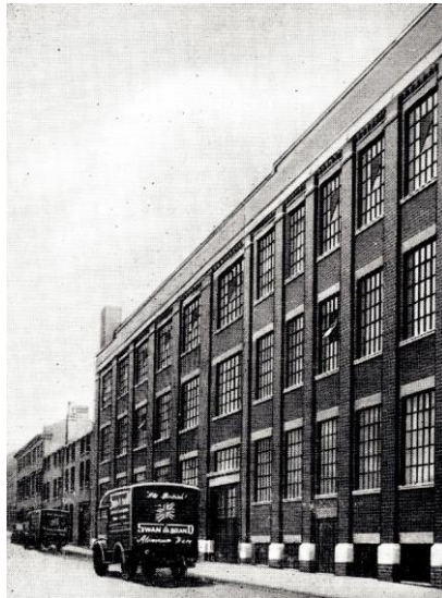
Camden St, Birmingham