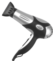
Hair Dryer AD 2224