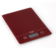
Electronic kitchen scale AD 3138