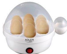
Egg Boiler AD 4459