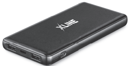
POWER BANK PBS10000 SLIM