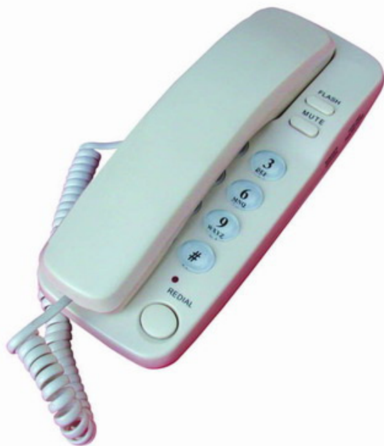
Aparat telefoniczny przewodowy