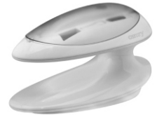
Manicure set CR2151