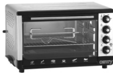
Electric oven CR111