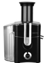
Juice extractor CR4105