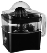
Citrus juicer CR 4001