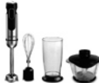
Hand blender CR4606