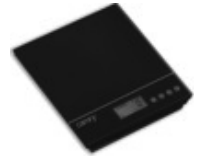
Kitchen scale CR107