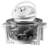
Halogen oven CR6305