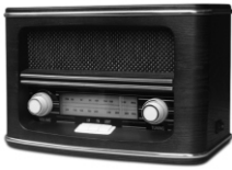
Retro radio CR1103