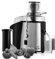
Juice extractor CR110