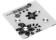
Bathroom scale CR106