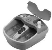
Foot spa CR2150