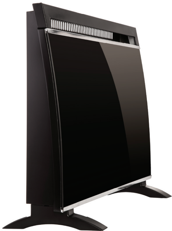
GRZEJNIK KONWERTOROWY MCH300K